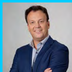
Boy Wesel Manager Strategic Partnerships

m.debruine@bouwinvest.nl +31 (0) 6 19 26 07 65