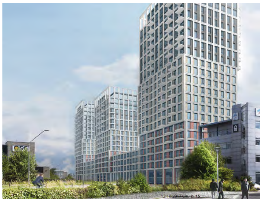
Het Dok, 314 middenhuurwoningen, NDSM-terrein, Amsterdam

Nederland heeft een groot tekort aan middenhuurwoningen, vooral in stedelijke gebieden. Bouwinvest wil bijdragen aan de oplossing. Voor onze bestaande portefeuille nemen wij maatregelen om de woningen bereikbaar te houden. Maar uiteindelijk is het toevoegen van veel extra woningen in alle segmenten de enige oplossing om de betaalbaarheid structureel op te lossen. Om dit te bereiken is het volgens Bouwinvest nodig dat alle betrokken partijen op alle niveaus samenwerken en soms bereid zijn concessies te doen. Alleen als gemeenten, woningcorporaties, institutionele beleggers en projectontwikkelaars bereid zijn de handen ineen te slaan, kan er een structurele oplossing komen voor het nijpend tekort aan dit segment huurwoningen in stedelijke gebieden.