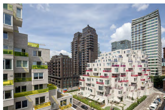
Summertime, 171 middenhuurwoningen, Amsterdam

Het tekort aan middenhuurwoningen in Nederland is sinds de wederopbouw na de Tweede Wereldoorlog ontstaan, omdat toen vanuit de overheid zwaar werd ingezet op eigen woningbezit (via de hypotheekrenteaftrek) en sociale huur (via woningcorporaties). De koop- en sociale huurwoningvoorraad zijn hierdoor de afgelopen decennia enorm toegenomen, ten koste van de middenhuurvoorraad. Omdat woningcorporaties sinds een paar jaar passend moeten toewijzen aan lagere inkomens, de prijzen van koopwoningen in veel steden enorm hard zijn gestegen en de hypotheeknormen steeds verder worden aangescherpt, is een groeiende doelgroep aangewezen op de middenhuur. De flexibilisering van de maatschappij draagt hier ook aan bij: huren wordt steeds populairder. De vraag naar middenhuur groeit harder dan het aanbod kan bijbenen, waardoor er nu een kwantitatief en kwalitatief tekort is.