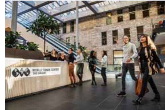
WTC The Hague