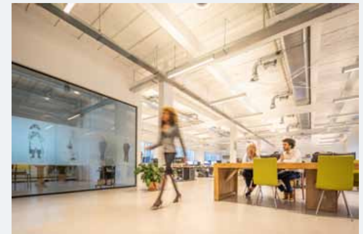
WTC Rotterdam Business Center